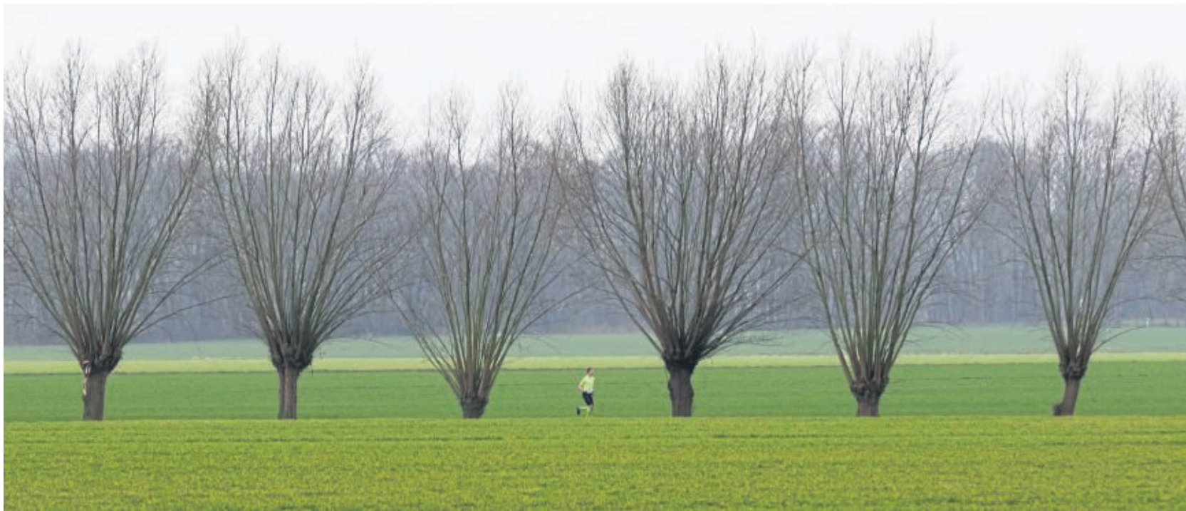
„Komplett offroad“: Die acht verschiedenen Strecken führten die Läufer querfeldein über Wege in der Gemeinde.