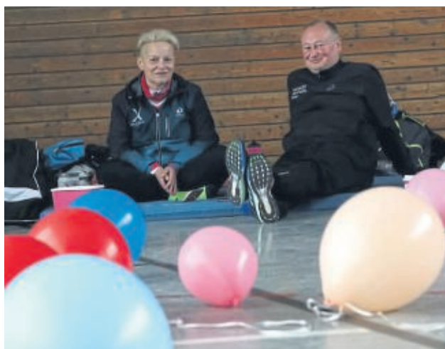
Die Ermelinghalle diente als Start und Ziel und für willkommene Ruhepausen.